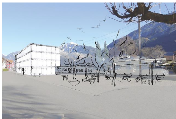
Neubau Bahnhofgebäude: gemäss Machbarkeitsstudie Ansicht Ost

Das Areal bietet aufgrund der guten Standortqualität und der bestehenden Infrastruktur eine einwandfreie Grundlage für einen publikumsorientierten Nutzungsmix. Gemäss einer Potenzial- und Marktanalyse gilt der Standort als ideal für publikumswirksame Nutzungen wie Retail/Convenience, Büro oder Wohnen.