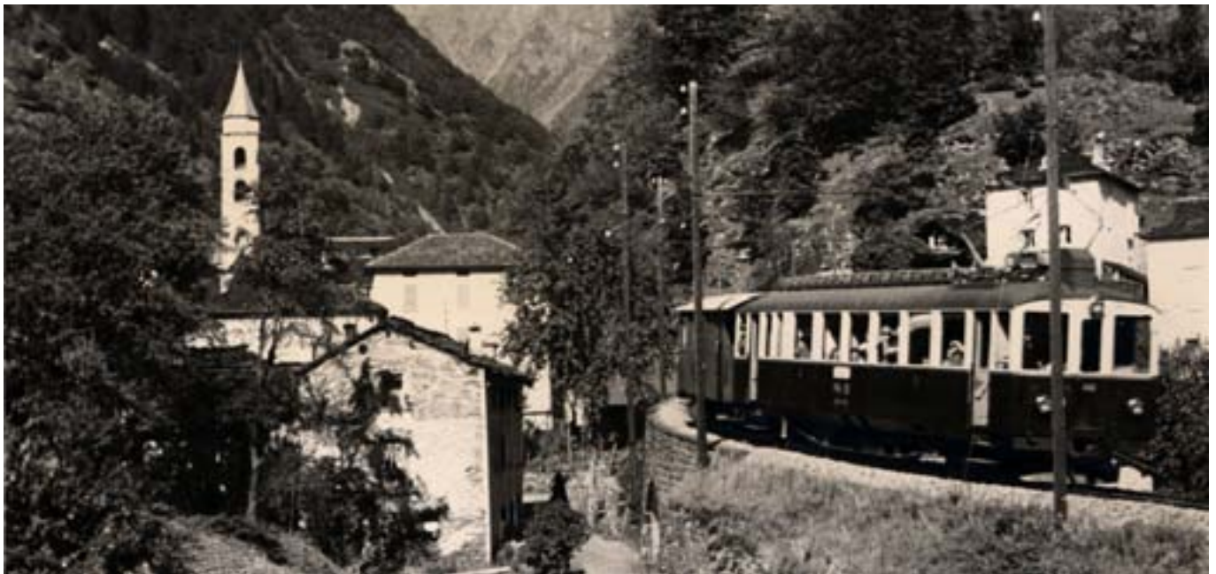
Linie Bellinzona – Mesocco > Ein Zug bei der Durchfahrt durch Soazza, Aufnahme aus den 1950er Jahren.