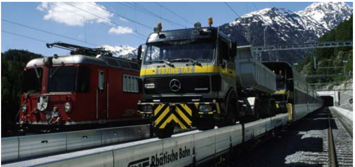
Vereinatunnel > Autoverlad beim weltweit längsten Eisenbahntunnel in Meterspur.