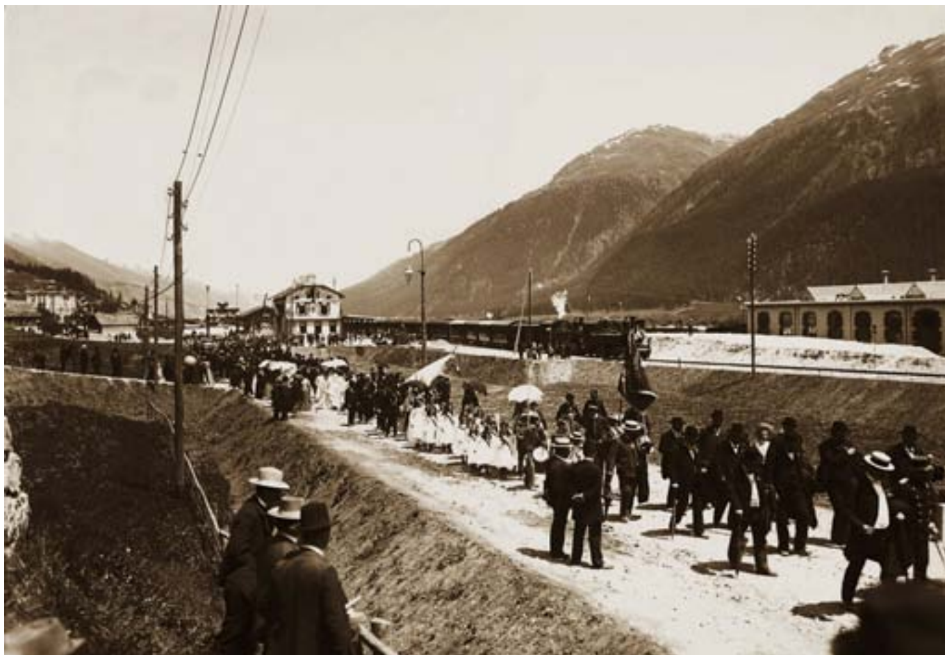
Samedan > Am 27. Juni 1903 eröffnete die Rhätische Bahn die Albulastrecke mit einem grossen Volksfest in Samedan. Rhätische Bahn