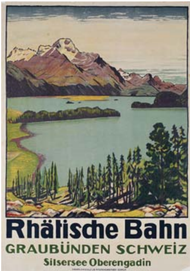
Plakat für die Rhätische Bahn von Emil Cardinaux, 1916. Auf die Abbildung einer Zugskomposition wurde erstaunlicherweise verzichtet.