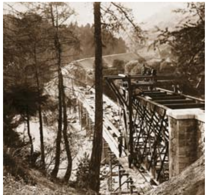
Strecke Chur–Thusis > Bau der Stahlbrücke über den Hinterrhein bei Reichenau. Aufnahme 1985.