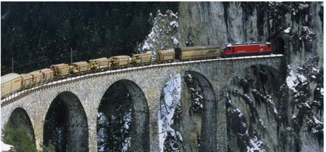
Albulastrecke > Die Rhätische Bahn als Güterbahn. Holz- und Lebensmitteltransport auf dem Landwasserviadukt. P. Donatsch