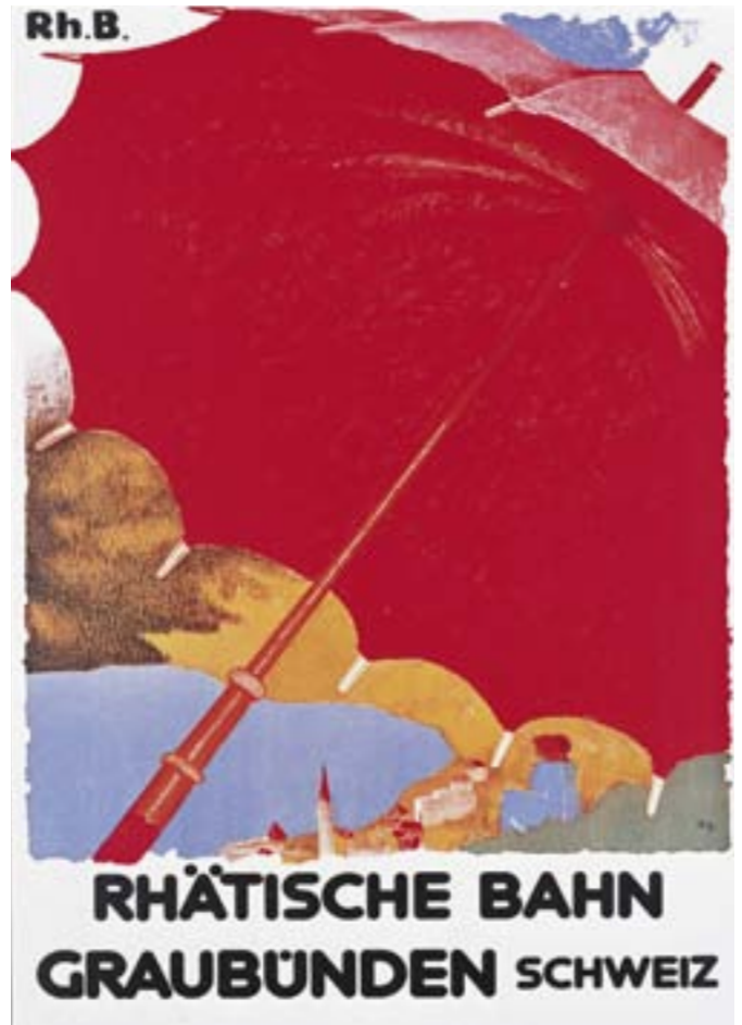
Plakat für die Rhätische Bahn von Augusto Giacometti, 1918. Auch hier «fehlt» die Darstellung eines Zuges. Rhätische Bahn / KGMZ