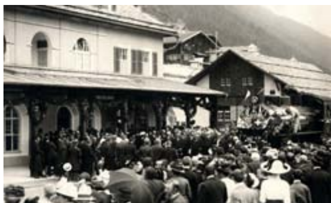
Strecke Reichenau-Disentis/Mustér > Am 30. Juli 1912 erreicht der Eröffnungszug mit der Lokomotive G4/5 Nr. 119 den geschmückten Bahnhof Disentis/Mustér. Rhätische Bahn