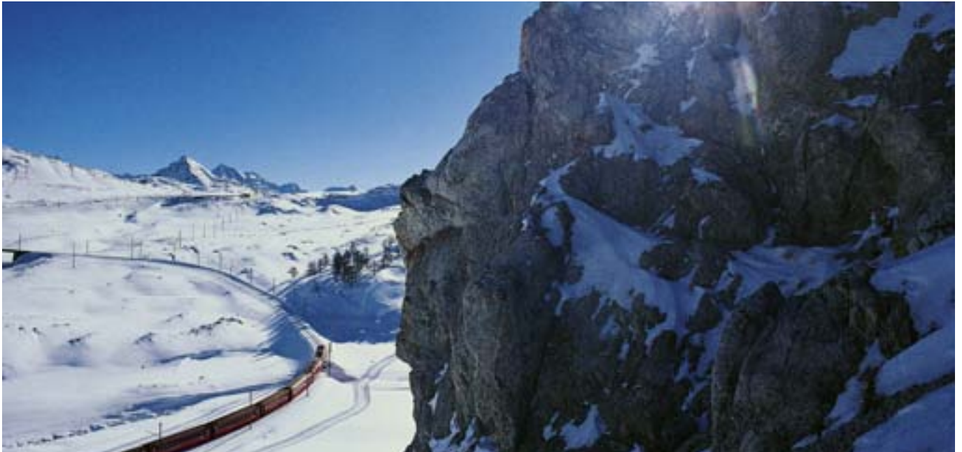
Berninastrecke > Der Bernina Express hat wesentlich zum internationalen Renommee der Rhätischen Bahn beigetragen. T. Keller