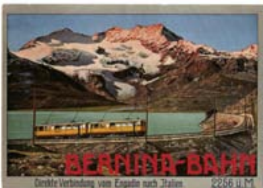
Postkarte für die Berninabahn, 1920. Künstler unbekannt.