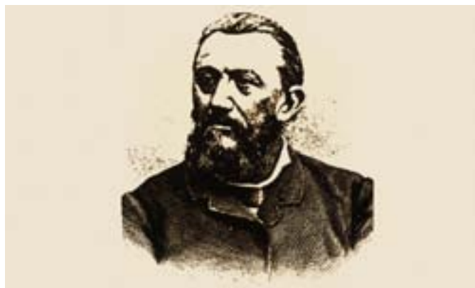
Willem Jan Holsboer (1834–1898) > Tatkraftiger Initiant und Förderer der Eisenbahnerschliessung Graubündens, um 1985. Rhätische Bahn