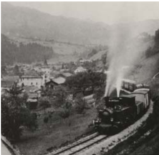
Strecke Landquart–Davos > Nach Küblis steigt das Bahntrasse mit 43% an. Rhätische Bahn