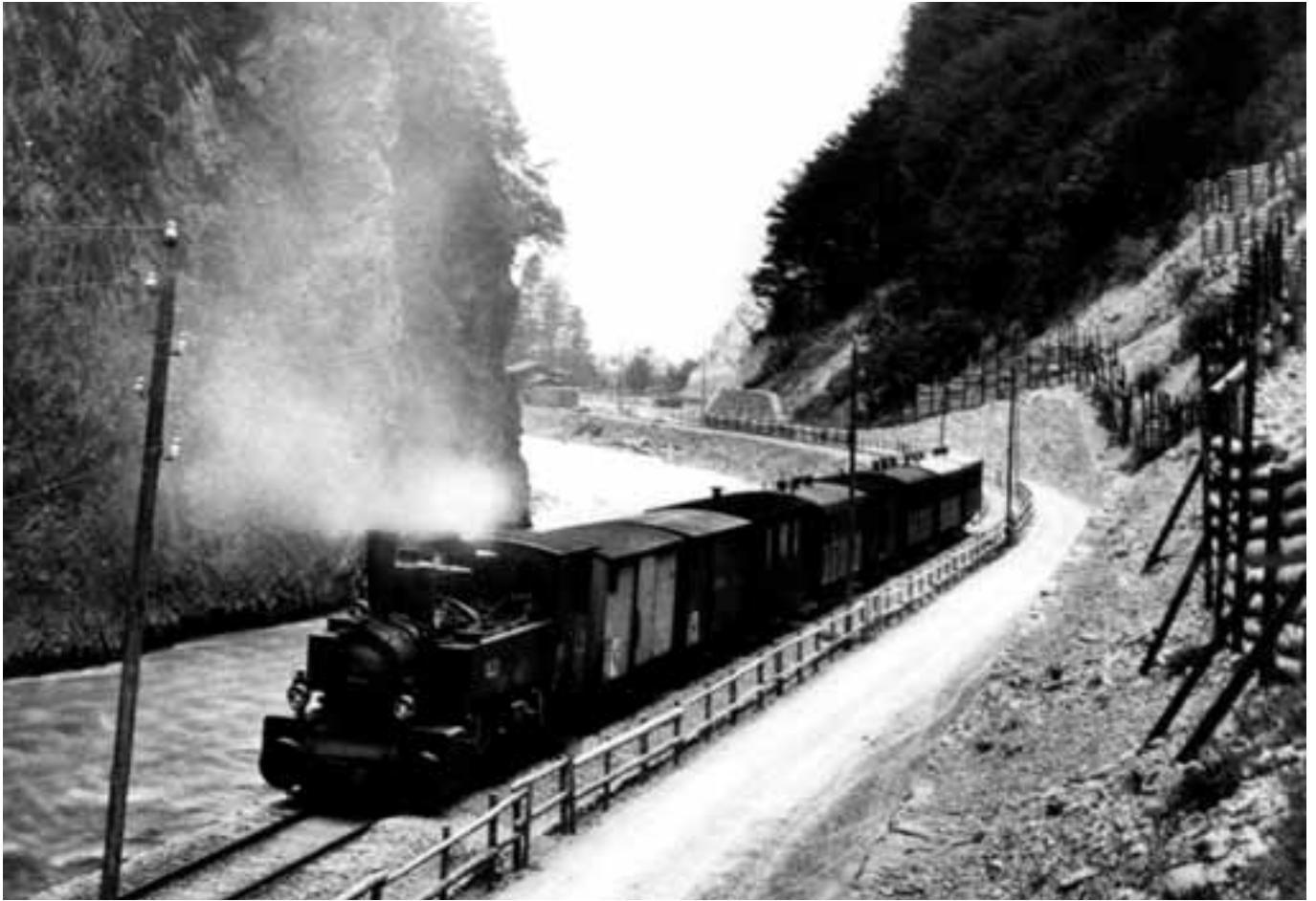
Strecke Landquart–Davos > Ein Personenzug der Schmalspurbahn Landquart-Davos, fährt durch die enge Schlucht (Klus) am Eingang des Präättigaus, Aufnahme 1891. Rhätische Bahn