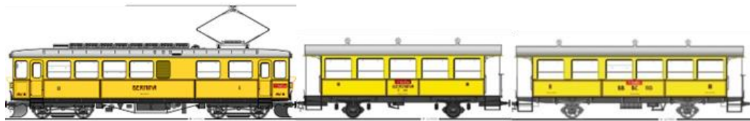
Triebwagen 30 14.70m