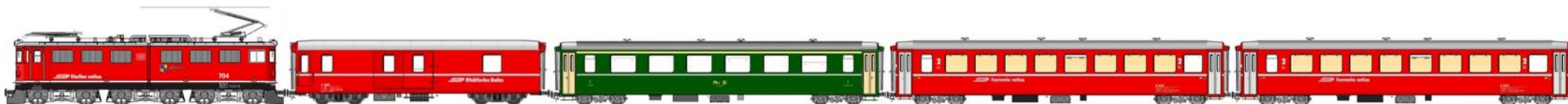
Lok 704 14.5m