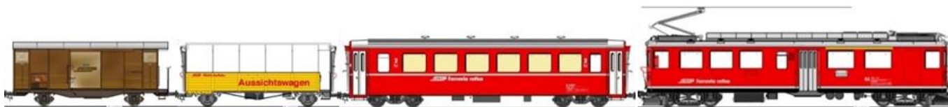
D2 4076ff 8.50m