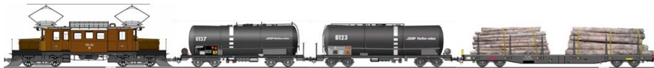
Lok 182 14m