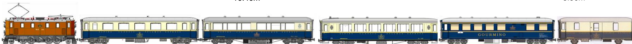
Lok 353 As 1161 WR-S 3820 (Pianobar) As 1141 ff WR 3812 D 4051 11.10m 16.40m 15.40m 16.40m 16.40m 10.70m