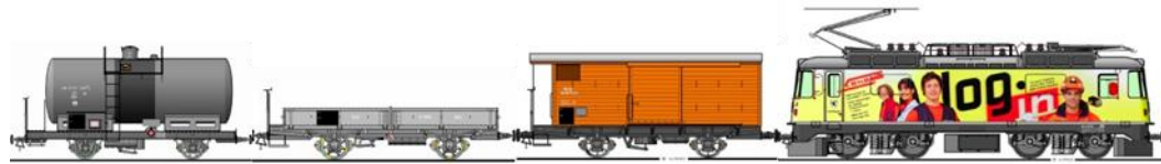
P 10070 8m