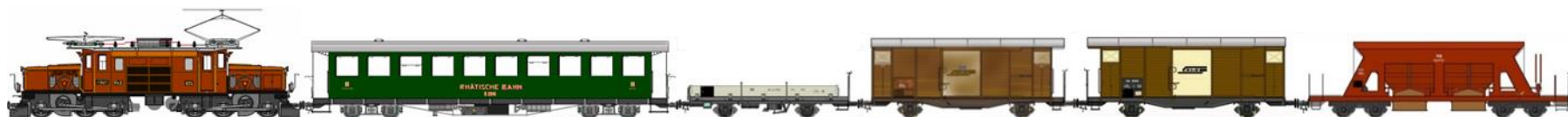
Lok 414 oder 415 13.30m