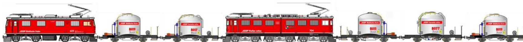
Lok 603 oder 605 12.10m