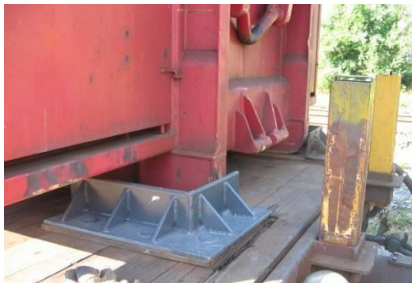
gut! Containeranschlätze mit wenig Spiel!