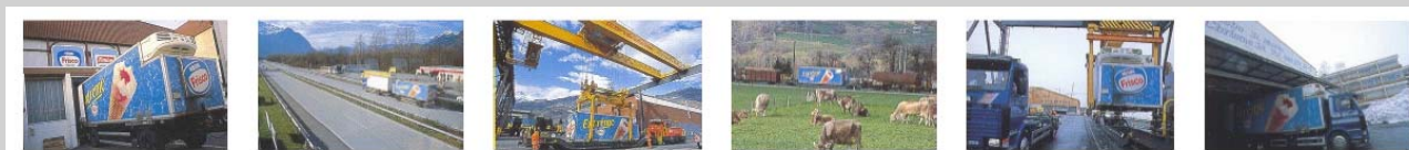
Der Wechselbehälter wird mit den Gütern beladen...